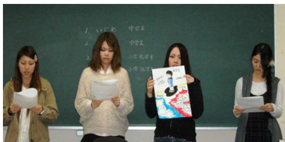
図2 グループ別発表(ストレスとは何かを小学校 高学年に説明)