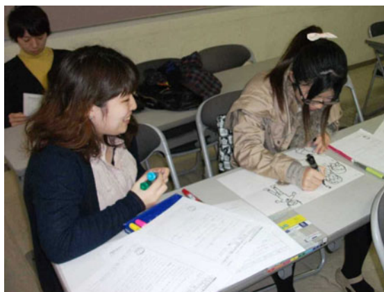
図1 グループワークの様子