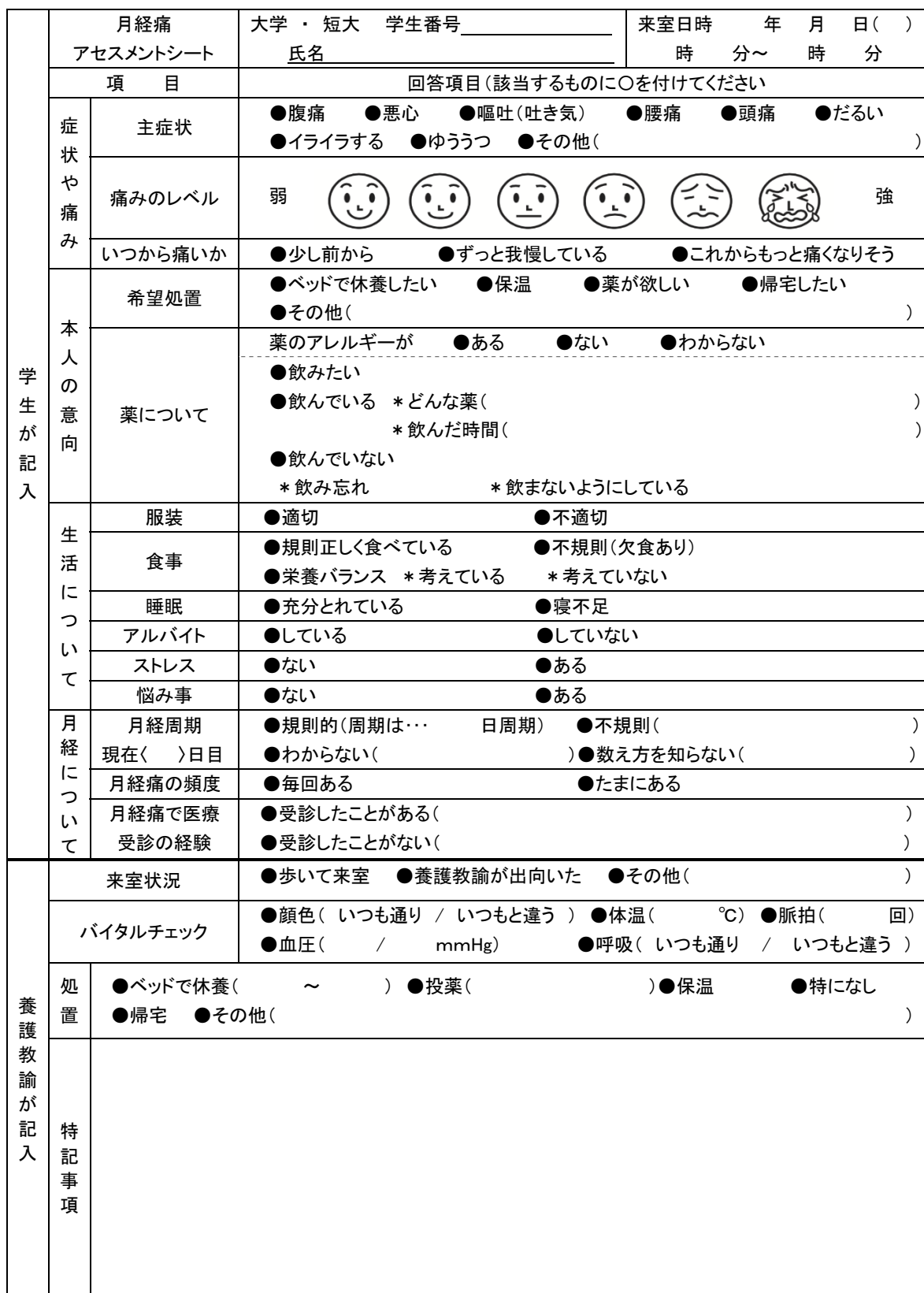
表 4. 月経痛アセスメントシート