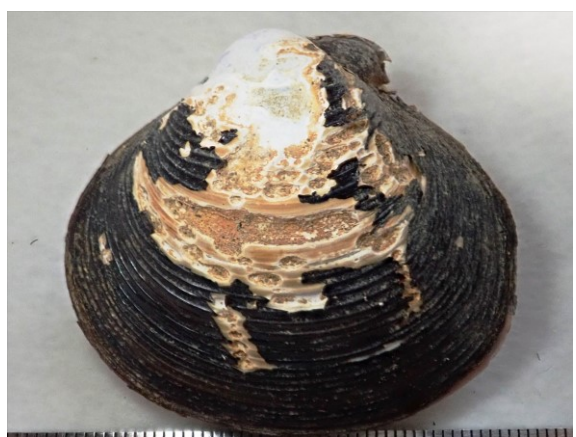
写真 12. 殻長 44.6 mm の大型マシジミ 愛知県では絶滅危惧Ⅱ類に選定されている