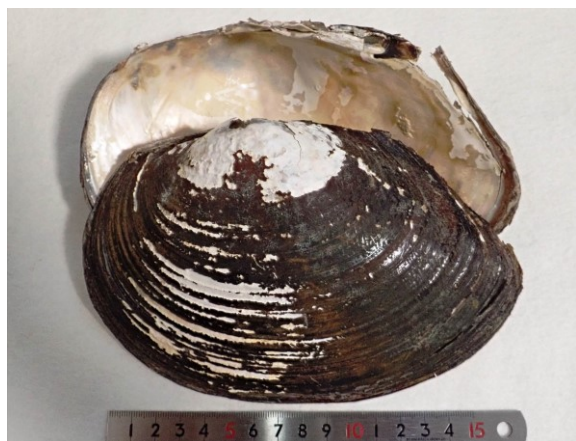
写真 10. ヌマガイ 愛知県では準絶滅危惧種に選定されている