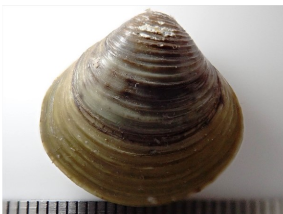
写真 11. 外来種タイワンシジミ 原産国は中国や朝鮮半島と考えられている