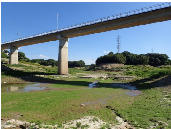
写真 1. 水抜きされた佐布里池 佐布里大橋の南西側から撮影した