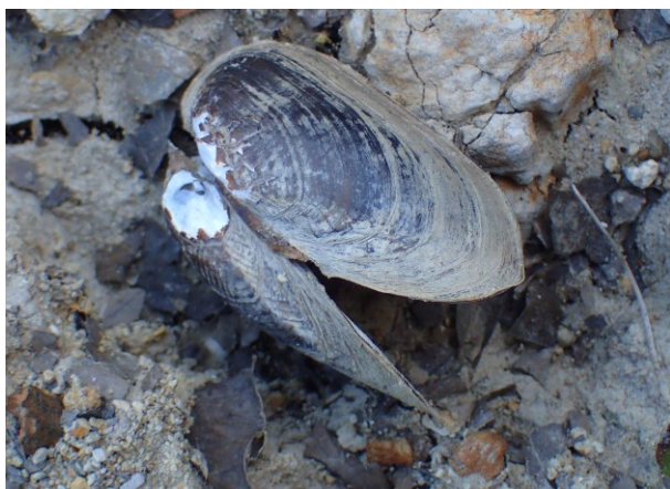
写真 5. 池底の合弁状態のイシガイ 水位低下により干出した池底で死んだと考えられる