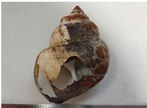
写真 3. 殻高 59.5 mm のマルタニシ 破損箇所は鳥類に捕食された可能性が高い