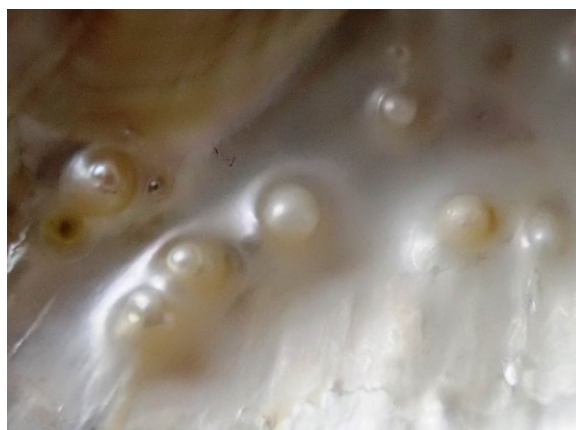
写真 8. イシガイに付着した淡水真珠 写真 7 を拡大して撮影した