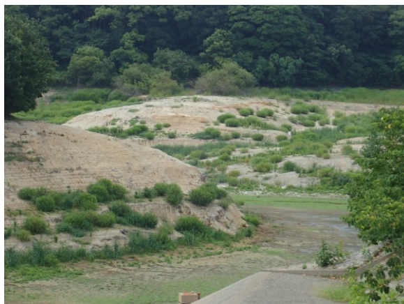
写真 2. 水抜きされた佐布里池 池底には草本植物が繁茂する