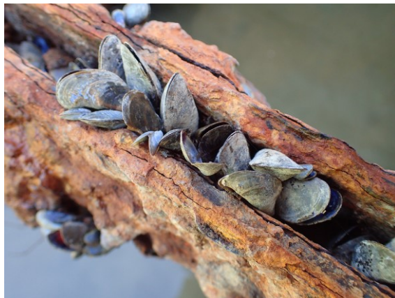
写真 4. カワヒバリガイ 池底の人工物に付着している