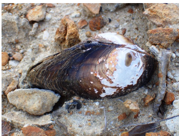
写真 9. 池底のヌマガイ 水がなくなり棲息姿勢のまま死んだと考えられる