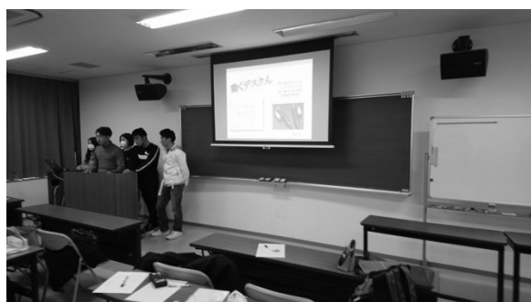
Figure 1 発表の様子（撮影時に掲載許可済）

各グループの発表内容に関連して筆者が、発表の最後に補足情報や知識等を伝えて解説を加えたり、そうした解説に繋がる質問をしたことや、発表自体を労ったり、雰囲気を作ろうと盛り上げたりしたことも、学生が積極参加した一因であっただろう。もちろん成績評価に加わることも大きかったと言える。